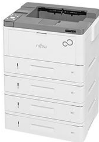
写真は拡張給紙ユニット3段装着時