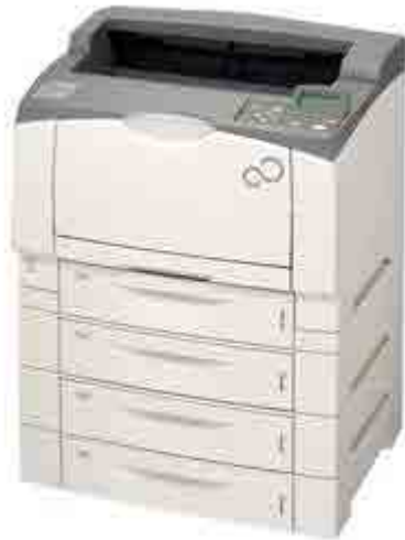
写真は拡張給紙ユニット3段装着時