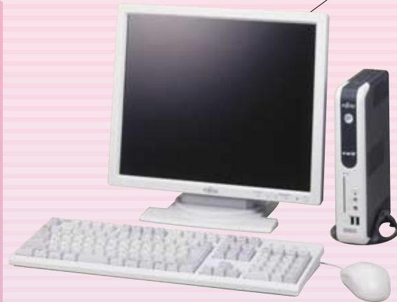
※ディスプレイ、キーボード、マウスは別売となります。