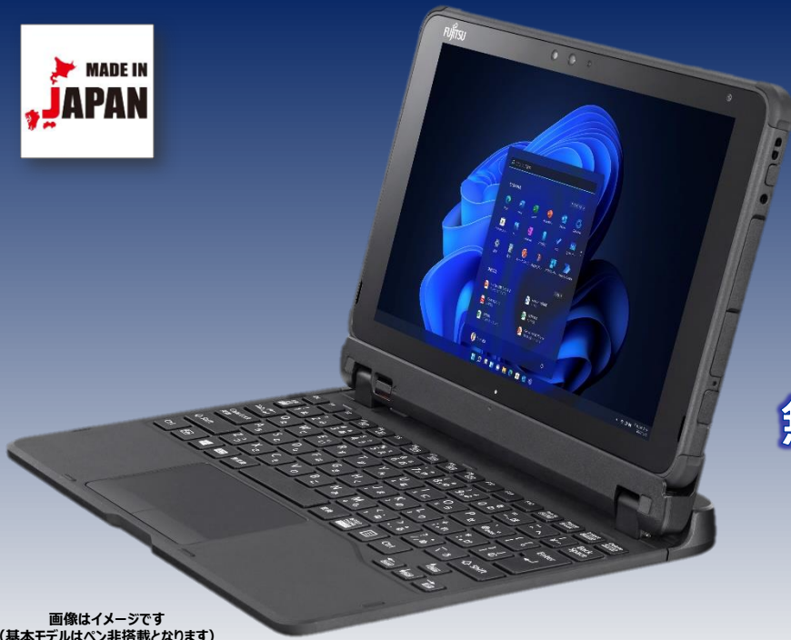
画像はイメージです (基本モデルはペン非搭載となります)

「GIGAスクール構想」 学習者用端末 標準仕様準拠モデル + 無線WAN (LTE対応)