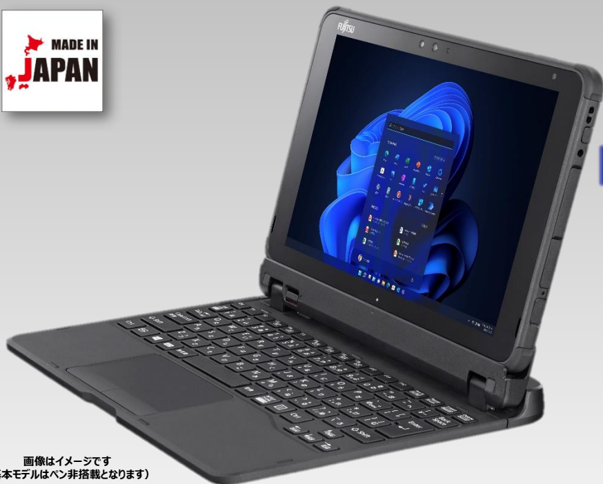
画像はイメージです (基本モデルはペン非搭載となります)